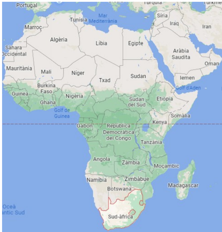
Imatge 4. Mapa d'Àfrica