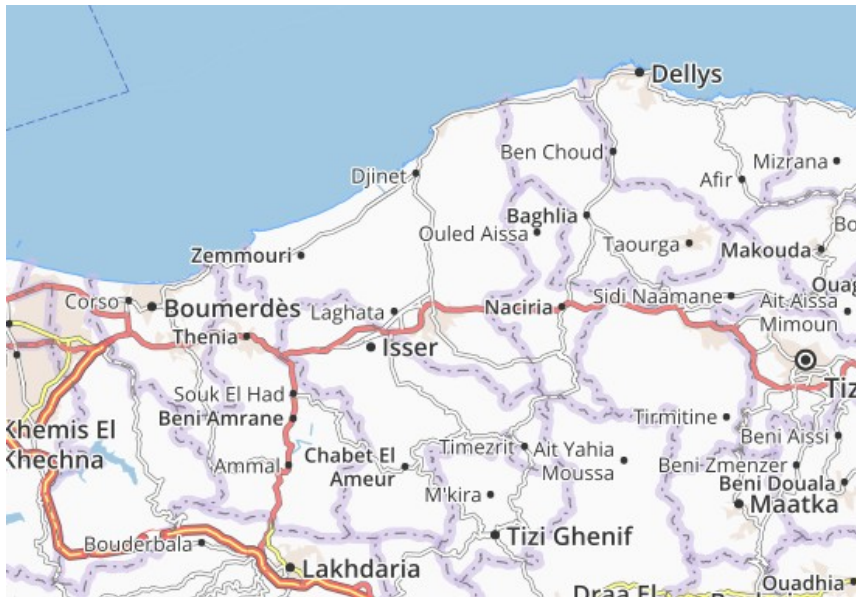
Imatge 1. Província de Boumerdès: superfície, 1.456,16 km; 80 km de costa; població de 786.602 habitants.