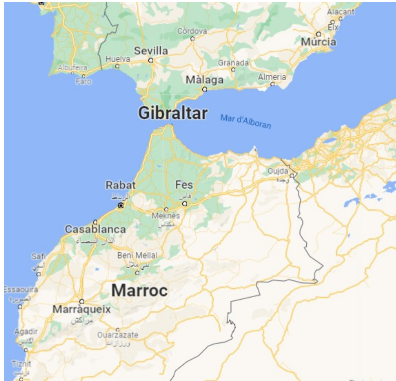
Imatge 3. Situació del Marroc.