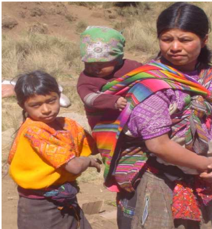
Dona esperant el repartiment de l'ajuda humanitària

Quant als indicadors sensibles al gènere , són aquells que permeten mesurar el grau de repartiment de mitjans i recursos, i els efectes aconseguits pel projecte quant a situació d'homes i dones que participen en les activitats, ja sigui de manera individual o col·lectiva. Hauran d'identificar les situacions que materialitzen les desigualtats de gènere. Han d'estar desagregats per sexes i reflectir el nivell i qualitat de la participació d'homes i dones, i també expressar "l'apoderament", mesurant la capacitat de dones i homes per prendre les seves pròpies decisions, controlar els recursos del projecte, etc.