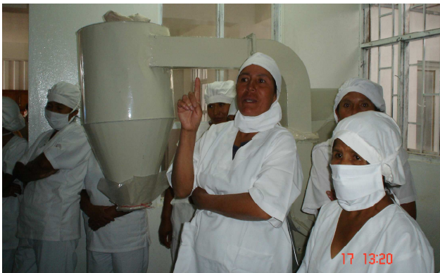
Molineres en una reunió de treball

La utilitat dels factores d'influència en les relacions de gènere ve donada per ser aquells que afecten el conjunt de drets, obligacions, oportunitats, etc., i posició de les dones i dels homes en una societat determinada influint de manera determinant sobre les accions de desenvolupament. Identifiquen i orienten les accions de desenvolupament, determinen la sostenibilitat de gènere en un projecte, fan visibles els factors que produeixen efectes no desitjats sobre les condicions de les dones i homes, a més de les relacions entre elles i ells.