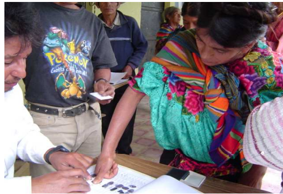
Dona guatemalenca signant un document

Sembla obvi que les raons estan directament vinculades a principis d'equitat i justícia social (principis constitucionals), a l'elemental exercici dels Drets Humans, així com a la necessitat de dotar de major qualitat al treball de cooperació per al desenvolupament.